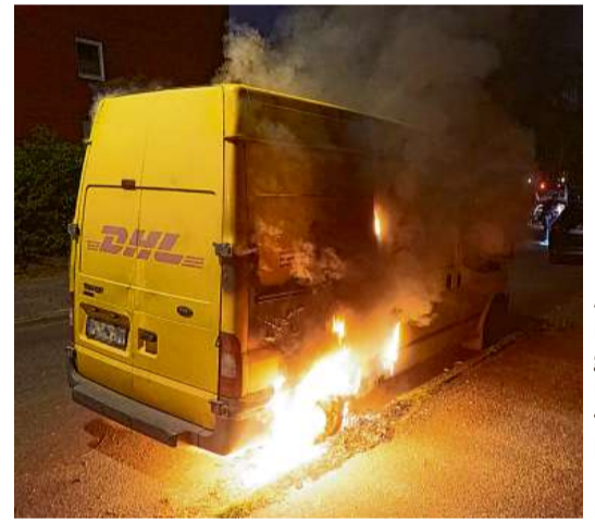
Am Rodeweg in Billstedt geriet ein DHL-Zustellfahrzeug in Flammen

BILLSTEDT/HORN Spezialisten der Polizei untersuchen die Ursachen von gleich drei Feuern in Horn und Billstedt: Am 11. Mai brannte in Billstedt an der Schlangenkoppel ein Lkw, die Flammen griffen auf drei weitere Autos über. Am vergangenen Sonntag brannte ein Rollcontainer an der Horner Rennbahn, laut Polizeisprecherin Nina Kaluza kam es zu Folgeschäden am P+R-Parkhaus. Schließlich ging in der Nacht zu Montag am Rodeweg ein Zustellfahrzeug der Post in Flammen auf. Laut Polizei wird jetzt geprüft, ob es sich um Brandstiftungen handeln könnte. (fbt)